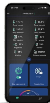
Lihtne juhtpaneel ja mobiiliäpp telefonis